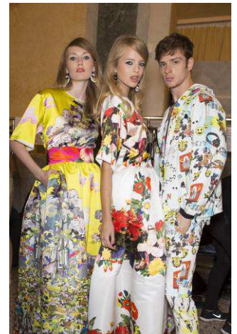
Backstage della sfilata Universal Dreamer 2015