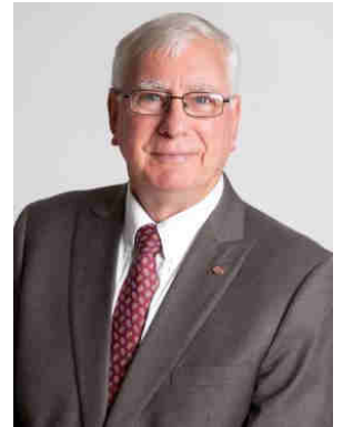
Ian H.S. Riseley, Presidente 2017-18

ci sono tante ragioni per affiliarsi al Rotary quanti sono i Rotariani – e forse anche più. Ognuno di noi, però è rimasto nel Rotary perché aggiunge qualcosa alla nostra vita. Attraverso il Rotary, noi possiamo fare la differenza; e più ci facciamo coinvolgere, maggiore diventa la differenza che il Rotary fa per ognuno di noi. Il Rotary ci spinge a migliorare come persone: diventare ambiziosi in modi che contano, mirare a realizzare obiettivi più importanti e incorporare il Servire al di sopra di ogni interesse personale nella nostra vita quotidiana.