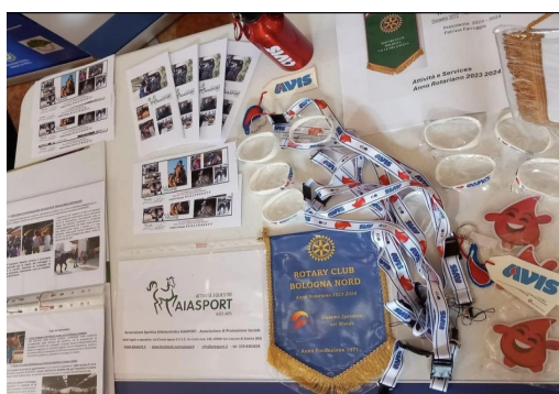
Il tavolo del Rotary Club Bologna Nord! AiaSport ed Avis sono solo alcune delle iniziative con cui il Club vuole "creare speranza nel mondo"