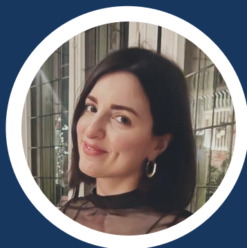
YLENIA MONDELLO Prefetto